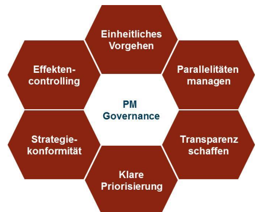
Abb.02: Ziele der PM-Governance