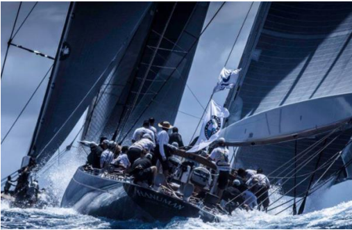
Abb.01: Regelwerk für den Erfolg

Die Projektmanagement-Governance regelt den Teil der Unternehmensführung, der sich mit den Umsetzungsdisziplinen wie Projektmanagement, Programm-Management und Portfoliomanagement befasst. Eine firmeneigene und massgeschneiderte Projektmanagement-Governance stellt eine funktionsfähige Projektsteuerung und Projektführung sicher, berücksichtigt die Stakeholderinteressen, stimmt die Projektziele mit den Unternehmensstrategien ab und sichert einen effizienten und nachhaltigen Mitteleinsatz.