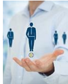
Führen ohne Macht