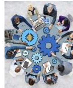
Requirements Engineering Foundation