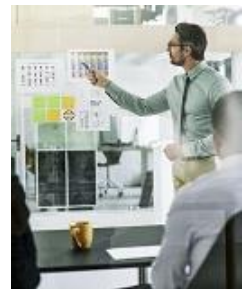
Projektanforderungen verstehen & beherrschen