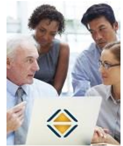
HERMES für Auftraggebende