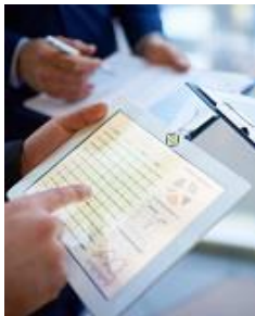
Aufwandschätzung in Projekten