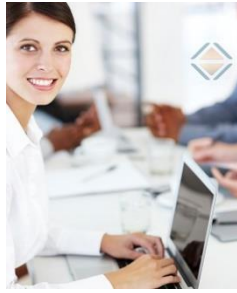
Projekte unterstützen als PMO-Mitarbeitende