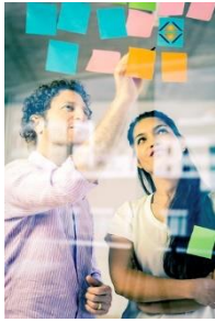
Grundlagen des Projektmanagements