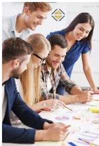
Projektmanagement Basic Training