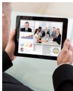
Projektmanagement Tools Day