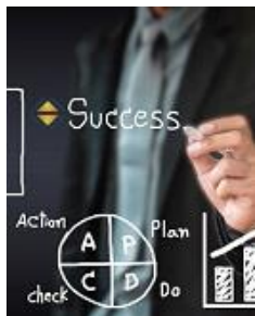
IPMA Level C & B Zertifizierungsvorbereitung