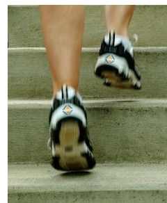
Agilität in Projekten