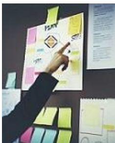
MS Project für agile Projekte einsetzen