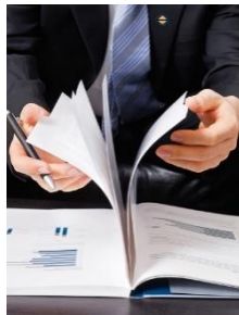
Projektmanagement Advanced Training