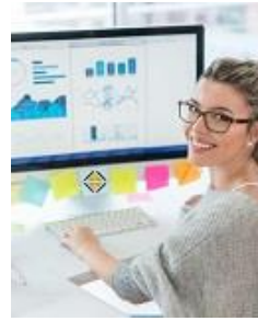
Projekte führen mit Excel