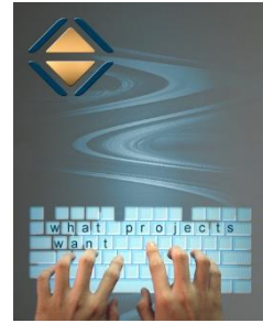
MS Project im Projektalltag